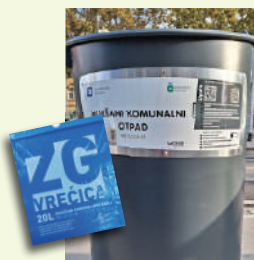
MIJEŠANI KOMUNALNI OTPAD

Odlaze se u ZG vrećicu samo ono što nije korisni otpad : vrećice iz usisavača, higijenski papir, vlažne maramice, zaprljani ili premazani voštani papir (npr. papirnati ubrusi, papir iz mesnice, papir za pečenje kolača), računi iz dućana od termo papira, ostaci termički obrađene hrane (meso, riba, kuhano povrće) i kosti, manje igračke, opušci, britvice za brijanje, izmet i pijesak za kućne životinje.