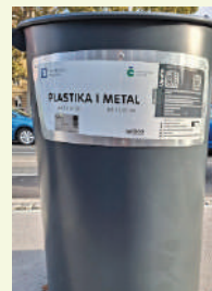
PLASTIKA / METAL

Odlazu se suhe i čiste novine, časopisi, prospekti, katalogi, bilježnice, mape i fascikli, kalendari, papirna – kartonska ambalaža.